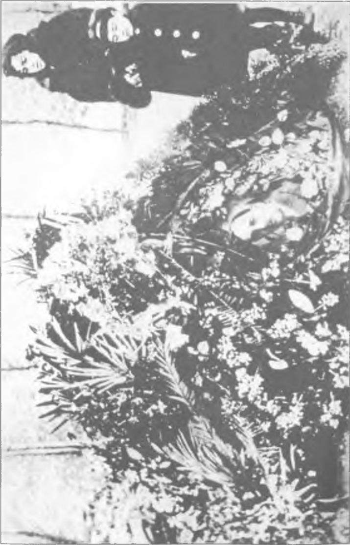
Nerimanov'un mezarı başında hanımı ve oğlu.