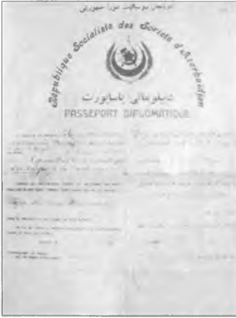
Nerimanov'un diplomatik pasaportu

çıktı ve mücadeleyi sokaktan yönetti. Kısa bir zaman sonra, bu insafsız ve acımasız katliamın önünü aldı.