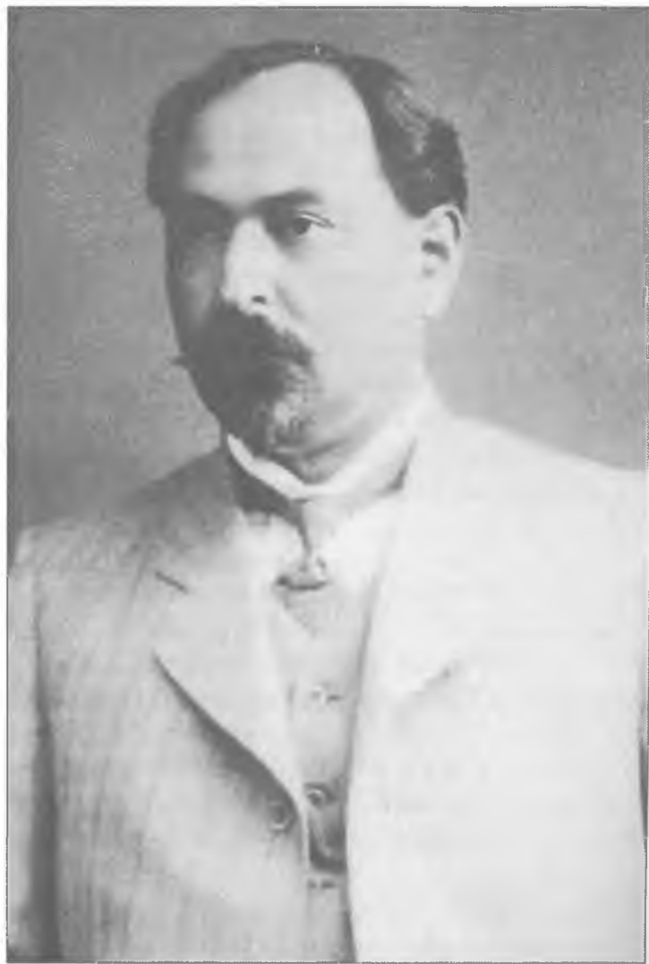
Neriman Nerimanov (1870-1925)