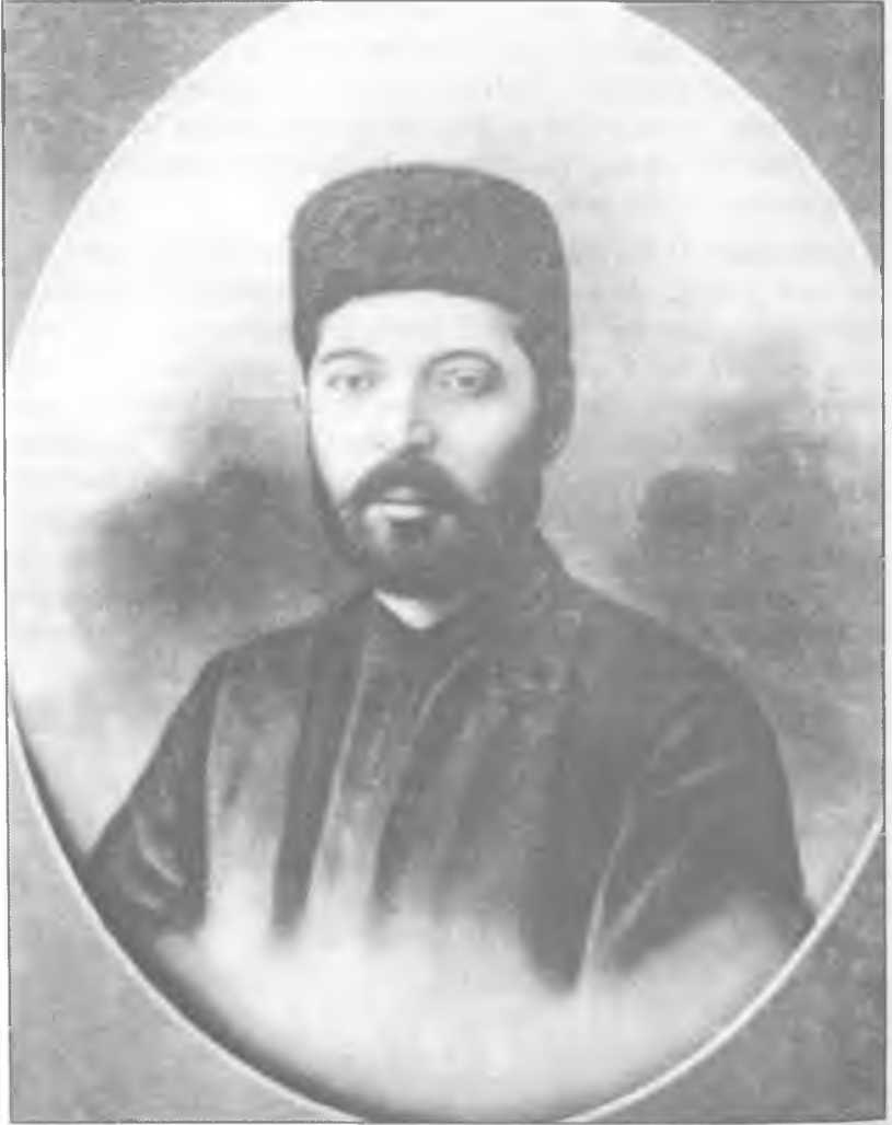
Nerimanov Astarhan'ı da sürgündeyken (1909)