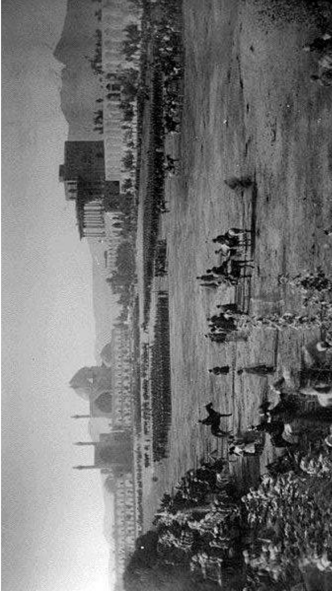
Şah qoşunlarının Nəqşi-cahan meydanında toplanması