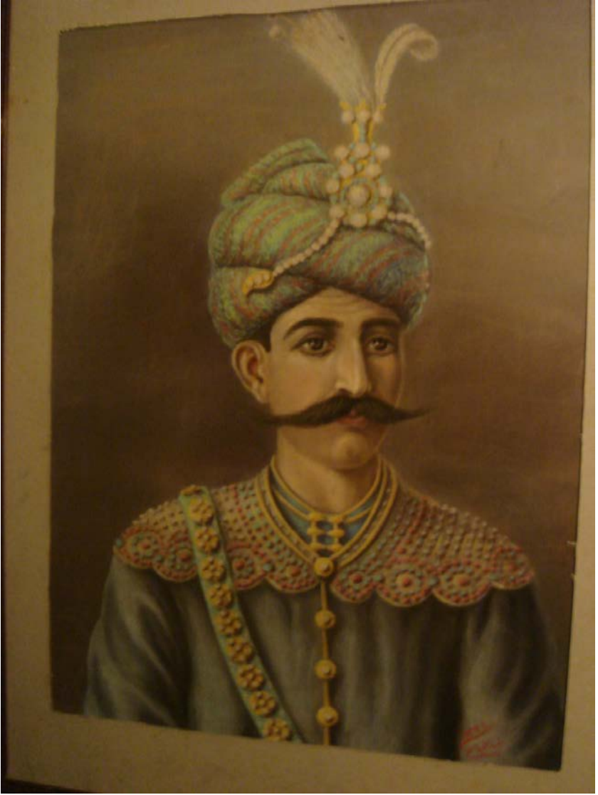
I Şah Abbasın portreti. Rəssam – Əli bəy Hüseynzadə