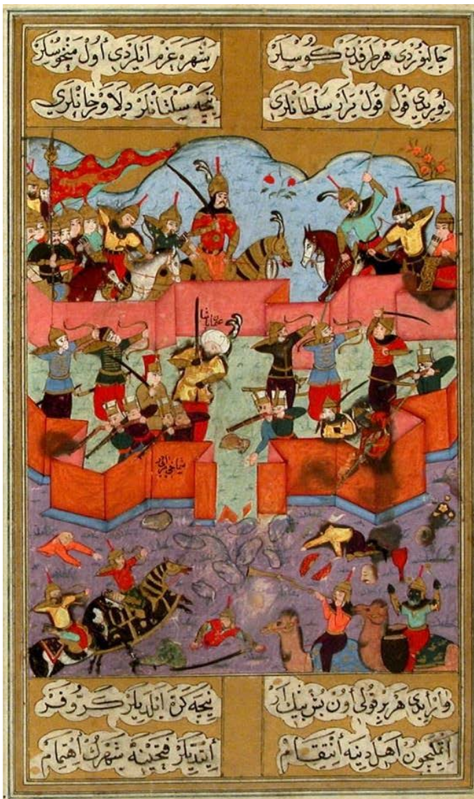
Osmanlı-Səfəvi döyüşündən bir səhnə (Şamaxı döyüşü)