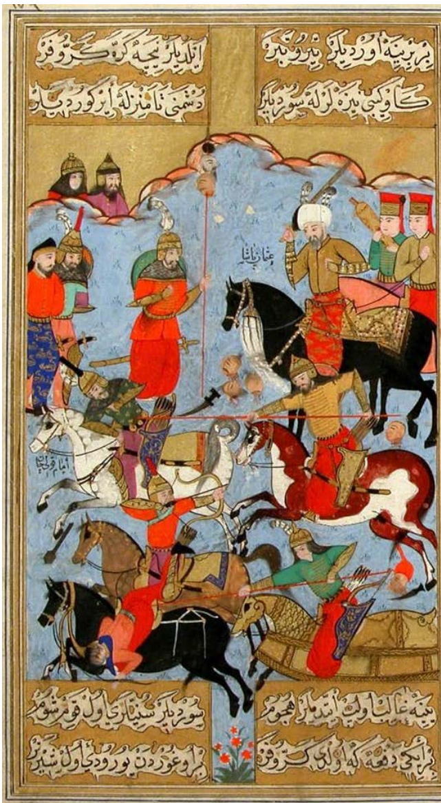
Osmanlı-Səfəvi döyüşündən bir səhnə