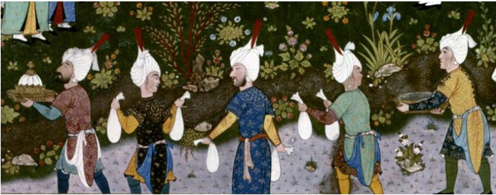
Şah Təhmasib Şahnaməsi”ndə əks olunmuş xidmətçilər