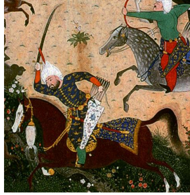
“Şah Təhmasib Şahnaməsi”ndə əks olunmuş qızılbaş əmirləri