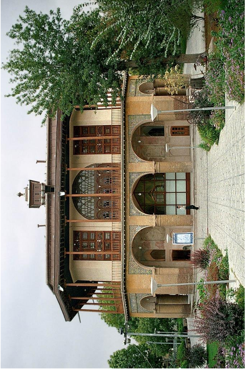
Şah Təhmasib tərəfindən tikilmiş Çehelsütun sarayı