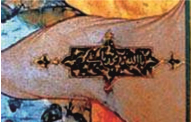
Şah Təhmasib dövrünün döyüş bayraqlarından nümunələr