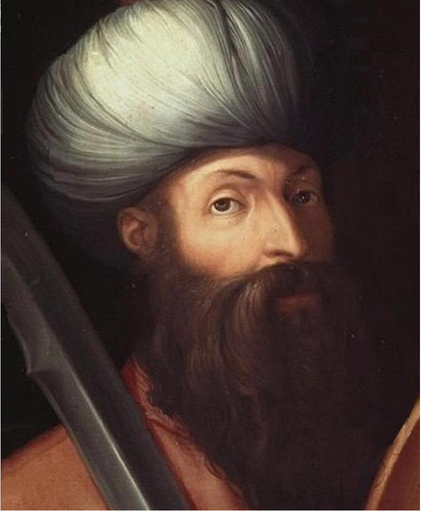
Şah Təhmasibin portreti