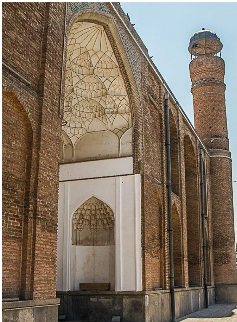
Qəzvində Şah Təhmasibin sifarişi ilə tikilmiş məscid