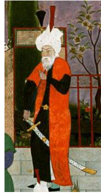
“Şah Təhmasib Şahnaməsi”ndə əks olunmuş mühafizəçilər