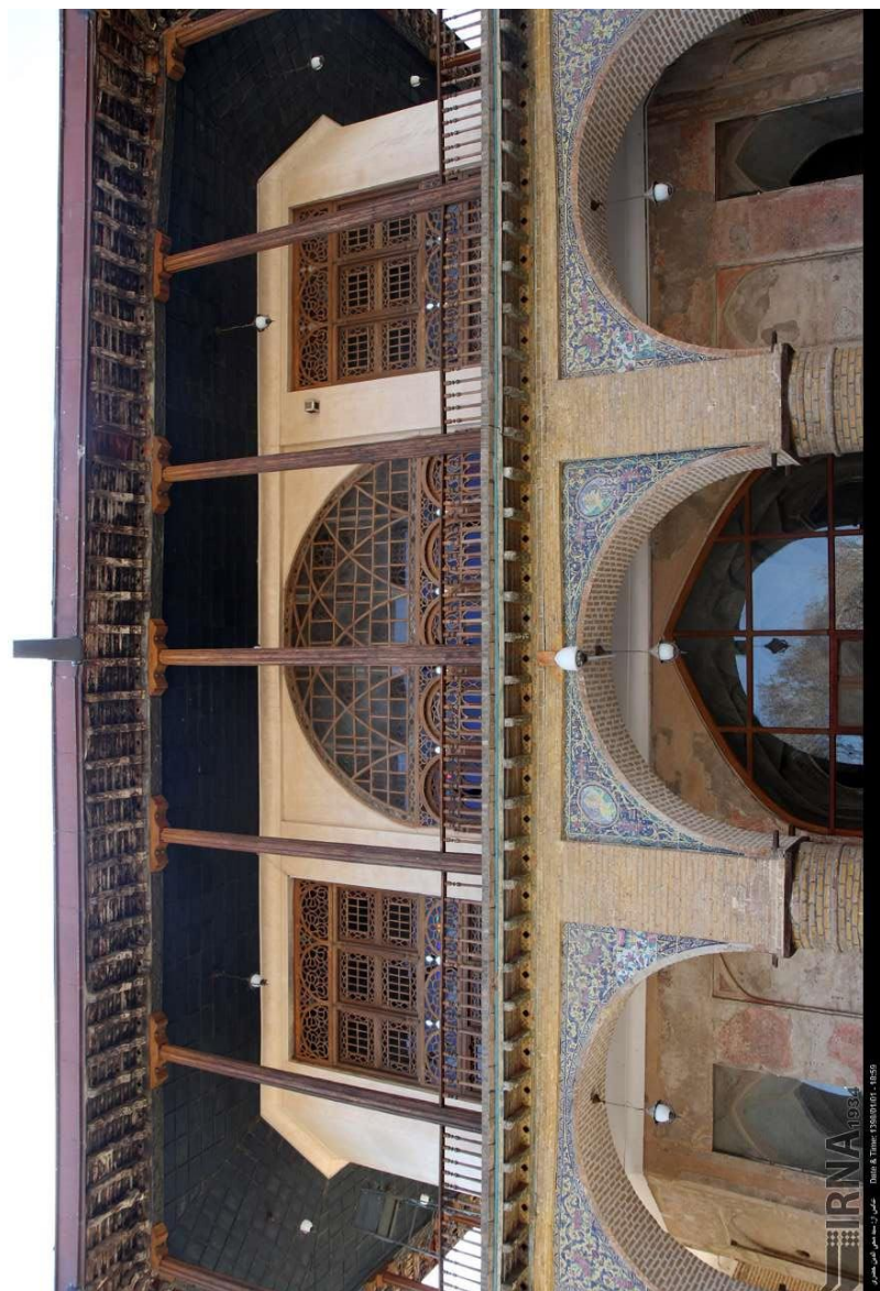
Şah Təhmasib tərəfindən tikilmiş Çehelsütun sarayı