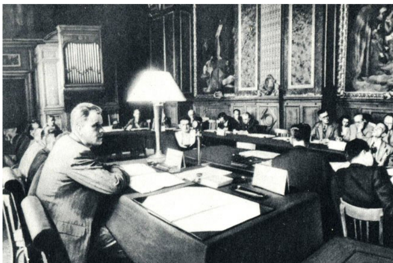
Paris Sülh Konfransında. Belarus Xarici İşlər Naziri Bolqarıstan məsələsi üzrə komissiyaya rəhbərlik edir

Amerika xarici siyasəti Yuqoslaviya cümhuriyyətlərinə qarşı böyük hücumlara keçmişdir. Sülh Konfransında Amerika və Yuqoslaviya nümayəndələri bir yerdə sülh məsələləri haqqında müzakirə edən zaman Amerikanın hərbi təyyarələrinin endirilməsindən sonra, o dövlətin Yuqoslaviya cümhuriyyətlərinə verdiyi "ultimatum" atom siyasətinin nümunələrindən hesab olunurdu. Yuqoslaviya və Amerika münasibətlərində üz verən bu hadisə yeni müharibə tərəfdarları üçün geniş bir fəaliyyət meydanı yaratmaqda idi. Vaşinqton siyasətçilərinin bu bacarıqsız əməlləri bütün dünyanı güldürəcək qədər yüngül və məsxərə idi.