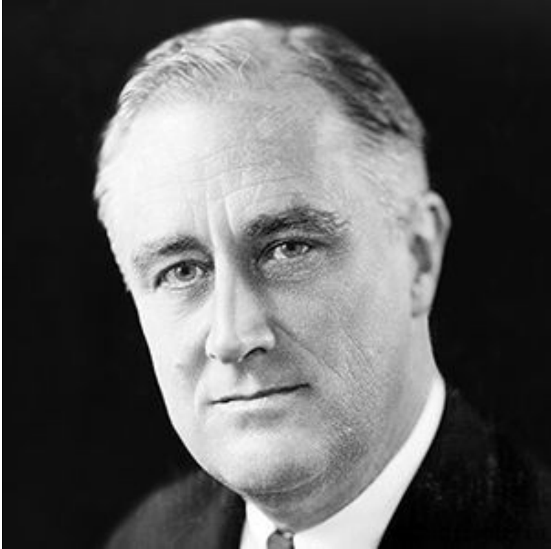
ABŞ prezidenti Franklin Ruzvelt (4 mart 1933 – 12 aprel 1945)