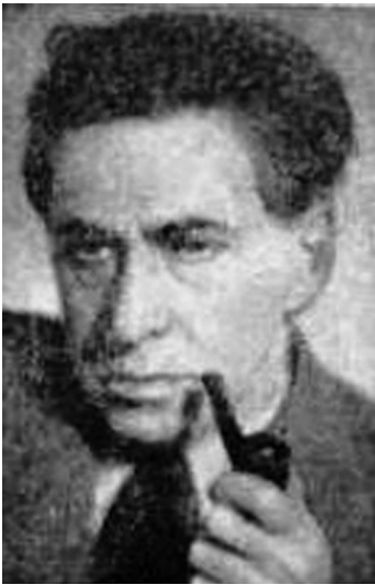
İlya Erenburq. 1891-1967

Məşhur Sovet yazıçısı və Fransa xalqının məşhur dostu İlya Erenburq Parisdən ayrılarkən “səfirələr klubu” tərəfindən düzənlənmiş böyük bir yığıncaq-