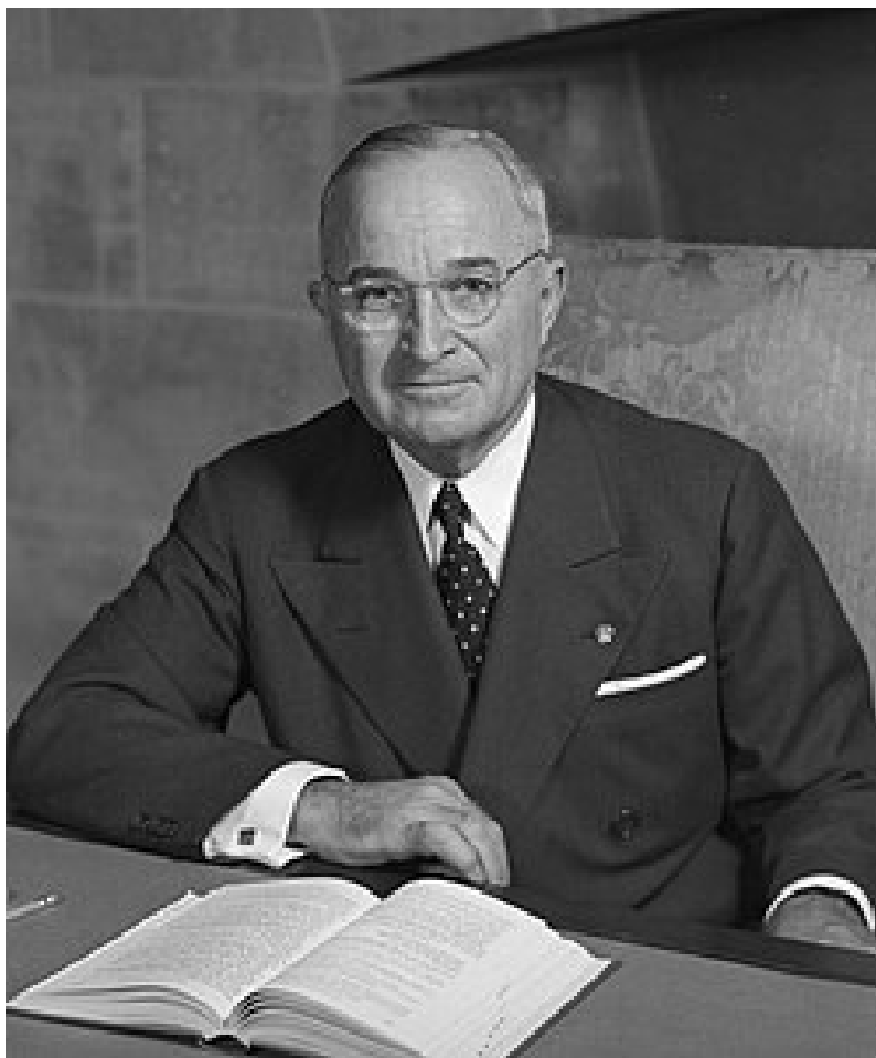
ABŞ Prezidenti Harri Trumen (12 aprel 1945 — 20 yanvar 1953)