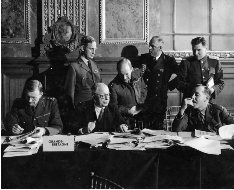
Paris Sülh Konfransı (29 iyul - 15 oktyabr, 1946). Yunanıstan nümayəndəsi Rodop dağlarına (Bolqarıstan) iddia edir.

da da Sülh Konfransında və yaxud Bolqar və Albaniya sərhədlərində bu iki millətə qarşı heç bir provokasiyadan çəkinmir.