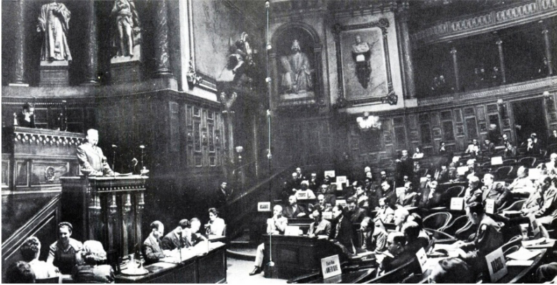
Paris Sülh Konfransı. 2 avqust 1946-cı il tarixli plenar iclas