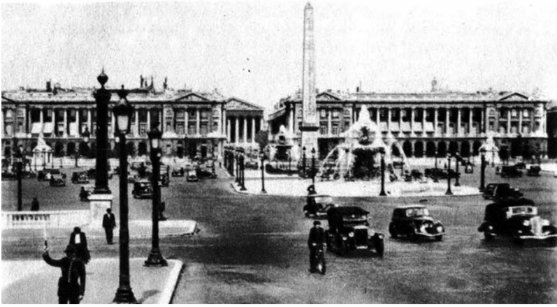
Paris. Konkord (Concorde) meydanı, 1946-cı il