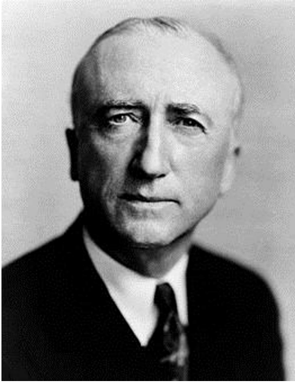
Ceyms Frensis Birns (1945-1947-ci illərdə ABŞ-ın dövlət katibi olmuşdur)

Amerika Birləşmiş Ştatlarının xarici siyasəti Almaniyadan başqa ayrı qitələrdə də özünə məxsus qiyafədə görünür.