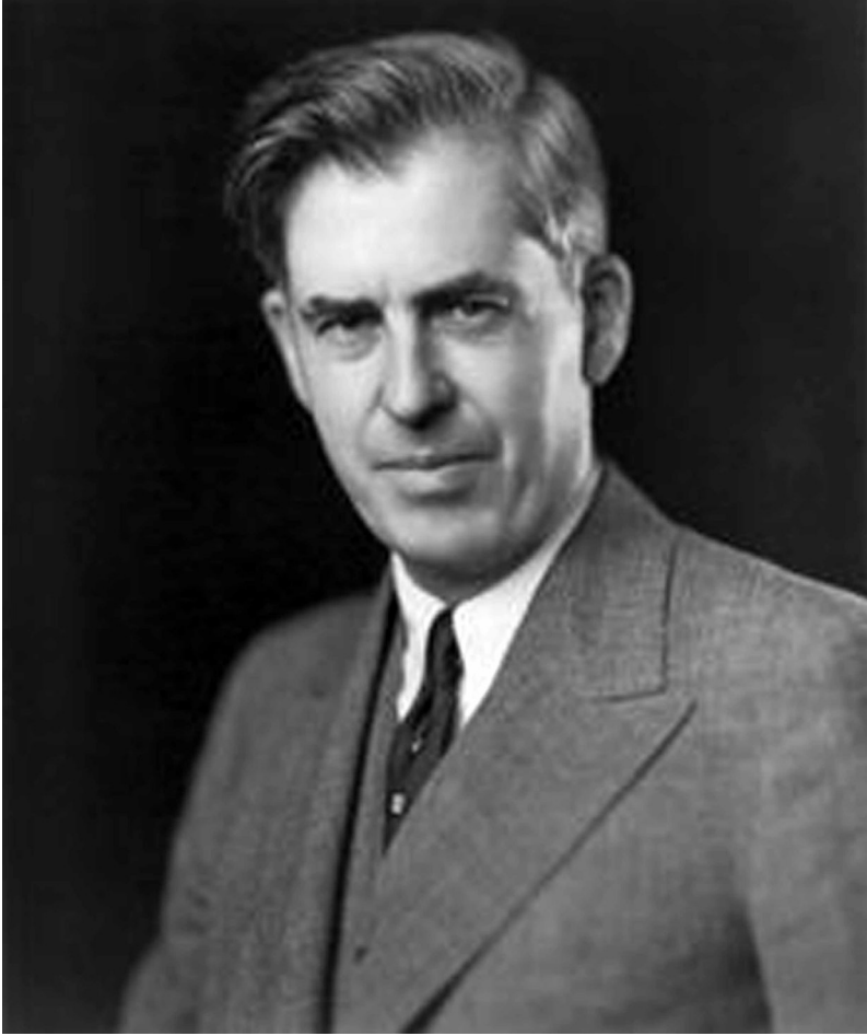
Uolles Henri Eqard (1933-1940-cı illərdə ABŞ-ın kənd təsərrüfatı naziri, 1941-1945-ci illərdə isə vitse-prezidenti olmuşdur)